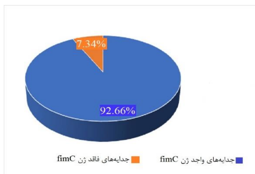
نمودار ۱. فراوانی جدایه‌های اشریشیاکلی عامل کلی‌باسیلوز واجد ژن fimC