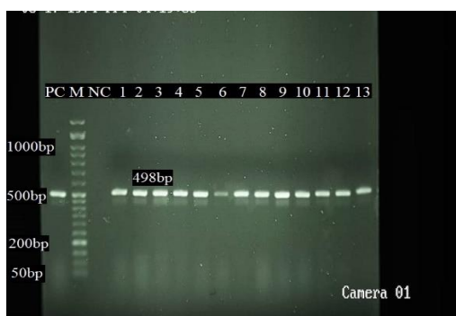
تصویر ۲. ژل الکتروفورز محصول PCR ژن fimC با اندازه باند ۴۹۸ (جفت بازی): PC: کنترل مثبت E. coli ATCC 25922، M: مارکر (50bp) سیناکلون (ایران)، NC: کنترل منفی، چاهک ۱ تا ۱۳ نمونه‌های مثبت