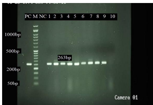
تصویر ۱. ژل الکتروفورز محصول PCR ژن iss با اندازه باند ۲۶۳ (جفت بازی): PC: کنترل مثبت E. coli ATCC 25922، M: مارکر (50bp) سیناکلون (ایران)، NC: کنترل منفی، چاهک‌های ۱ تا ۹ نمونه‌های مثبت، چاهک ۱۰: کنترل بلانک