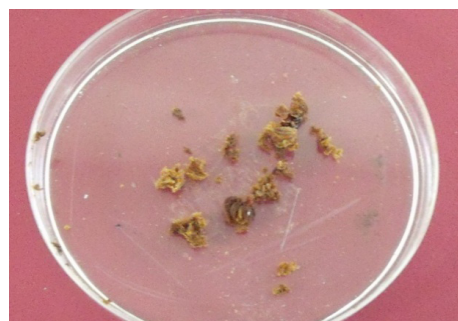
شکل ۱- بیوسورفکتانت خام

به این صورت که کلنی سویه انتخابی به ارلن ۱۰۰۰ میلیلیتر محتوای ۵۰۰ میلیلیتر نوترینت برات کشت و همراه با ۱۰ میلیلیتر n-هگزان به عنوان منبع هیدروکربن اضافه شد سپس مخلوط در دمای ۳۰ درجه سانتیگراد به مدت ۷ روز با شیکر rpm ۱۵۰ گرمخانهگذاری شد. پس از آن سلولهای باکتری بوسیله سانتریفیوژ در rpm ۵۰۰۰ در دمای ۴ درجه سانتیگراد به مدت ۲۰ دقیقه حذف و مایعروبی جمعآوری شد. pH مایع با استفاده از اسیدسولفوریک ۱ مولار به ۲ تنظیم شد و بعد از آن به حجم برابر کلروفرم و متانول (۱:۲) اضافه شد. سپس فاز آلی مجزا شده و حلال در آن در دمای ۶۰ درجه تبخیر گردید. فراورده نهایی به رنگ قهوه‌ای تیره و قوام چرب به عنوان بیوسورفکتانت خام بدست آمد (شکل ۱) بیوسورفکتانت خشک بدست آمده از هر سویه وزن شد واز آنها رقتهای متوالی شامل ۱۰۰۰، ۵۰۰، ۲۵۰، ۱۲۵ و ۶۳ میلیگرم بر میلیلیتر در ۱ میلیلیتر حلال دی متیل سولفوکساید ۶ تهیه شد رقتهای هر بیوسورفکتانت جهت بررسیهای ضد باکتریایی مورد استفاده قرار گرفت (۳).