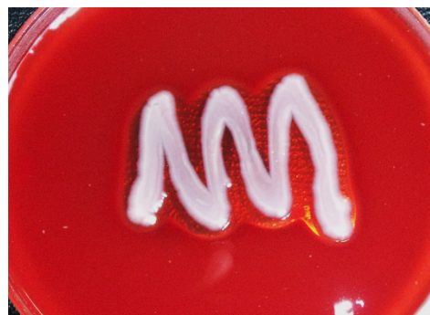
شکل ۲- نمونه ای از فعالیت همولیز بتا در باکتریها

جدول ۲- خصوصیات بیوشیمیایی سویه انتخابی تولیدکننده بیوسورفکتانت