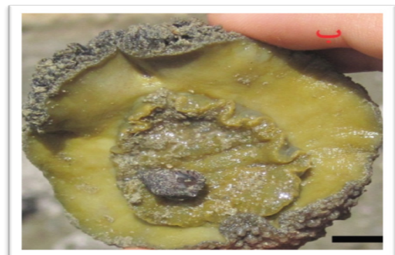
تصویر شماره ۳: گونه ی Peronia peronii از سواحل تیس در جنوب شرق ایران. شکل الف : سطح پشتی ؛ ۱_ تاناکول ها .