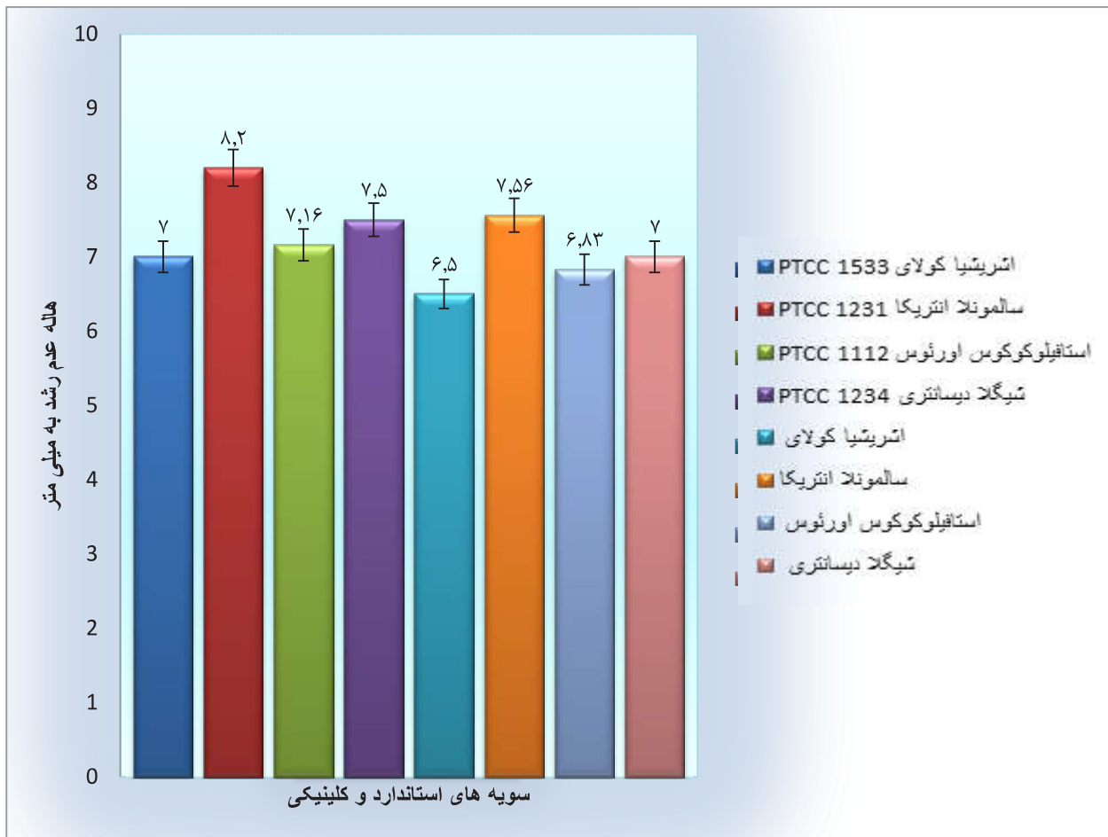
شکل ۲: مقایسه فعالیت ضد میکروبی مایع روی کشت اگزینگویاکتریوم/استیلیکوم بر علیه سویه های پاتوژن و استاندارد/اثریشیا کولای، سالمونلا انتریکا، استافیلوکوکوس اورئوس و شیگلا دیسانتری به روش انتشار از دیسک