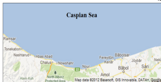
شکل ۱- محل های مورد مطالعه برای جمع آوری نمونه های آب از سواحل دریای خزر

(۱.۴ M NaCl, ۱۰۰ mM Tris-HCl pH ۸.۰, ۵٪ CTAB) [(w/v)] اضافه و به مدت ۱۰ دقیقه در بن ماری ۶۵°C انکوبه شد. سپس ۷۰۰ میکرولیتر مخلوط فنل/ کلروفرم/ ایزوآمیل الکل (۱:۲۴:۲۵، v/v) را به میکروتیوب اضافه و به مدت ۱۰ دقیقه در دور ۱۲۰۰۰ rpm سانتریفیوژ شد. سپس هم حجم فاز رویی مخلوط کلروفرم/ ایزوآمیل الکل (۱:۲۴، v/v) اضافه و سانتریفیوژ شد.