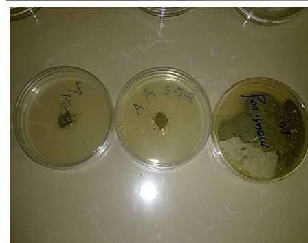
شکل ۱- مهار رشد اسپرژیلوس نایجر توسط ایزوله های جدا شده از چشمه آب گرم