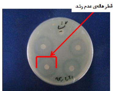
شکل ۱- قطر هالی عدم رشد باکتری سودوموناس آئروژینوزا (۲.۶ سانتی متر) در مقابل ۰.۴ میلی مول فلز سنگین کادمیوم

یک نمونه از نتایج به دست آمده ناشی از، عدم رشد باکتری سودوموناس آئروژینوزا در مقابل کادمیوم، که به صورت هاله‌ای (ناحیه‌ای که باکتری در آن رشد نکرده است)، قابل رؤیت می‌باشد، در شکل ۱ آورده شده است.