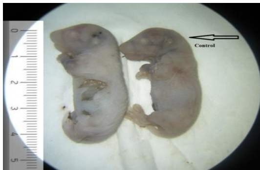
شکل ۳. مقایسه اندازه CR گروه کنترل و غلظت ۱۲۵ میلی گرم/کیلوگرم/روز