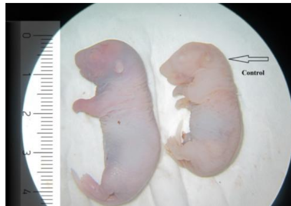
شکل ۱. مقایسه اندازه CR گروه کنترل و غلظت ۱۵۰۰ میلی گرم/کیلوگرم/روز

پس از جراحی سزارین، CR جنین ها همانند قد آن ها اندازه گیری شد. اندازه CR جنین ها توسط نرم افزار Image J آنالیز شده و مشاهده شد که نانو ذره نقره موجب افزایش CR در جنین های گروه های تیمار نسبت به گروه کنترل نیز شده است. (جداول ۵-۸ و نمودار ۲)