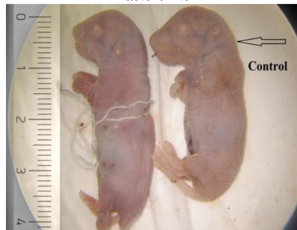
شکل ۲. مقایسه اندازه CR گروه کنترل و غلظت ۷۵۰ میلی گرم/کیلوگرم/روز