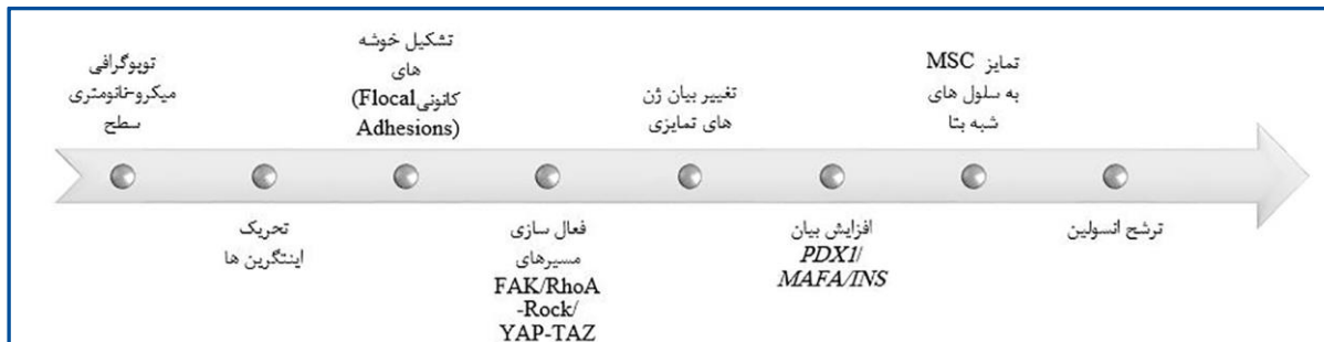
شکل ۳- فلوجارت مفهومی نقش محرک‌های فیزیکی سطح در چگونگی هدایت تمایز MSCs‌ها به سلول‌های شبه‌بتا.

شکل ۲- مراحل انجام تکنیک Cell Imprinting جهت تمایز فیزیکی سلول‌های بنیادی به سلول‌های شبه‌بتای تولیدکننده انسولین. در این روش، ابتدا MSCs تحت شرایط استاندارد کشت داده می‌شوند و پس از رسیدن به تراکم سلولی مناسب، به‌عنوان سلول‌های هدف برای تمایز مورد استفاده قرار می‌گیرند. هم‌زمان، بسترهای قالب‌گیری شده از سلول‌های شبه‌بتای طبیعی پانکراس با استفاده از پلی‌دی‌متیل‌سیکلوکسان (PDMS) تهیه می‌شوند تا ویژگی‌های فیزیکی و توپولوژیکی سطح سلول‌های بتا شبه‌سازی گردد. در ادامه، MSCs بر روی این بسترهای زیست‌الگوبرداری شده کشت داده شده و تحت شرایط انکوباسیون مناسب قرار می‌گیرند تا فرایند تمایز القا شده توسط ریزمحیط فیزیکی آغاز شود. پس از سپری شدن مدت زمان مورد نیاز برای تمایز (۲۱ روز)، سلول‌های تمایز یافته از نظر مورفولوژیکی، عملکردی و مولکولی مورد ارزیابی و تحلیل قرار می‌گیرند (۶۹، ۸۰).