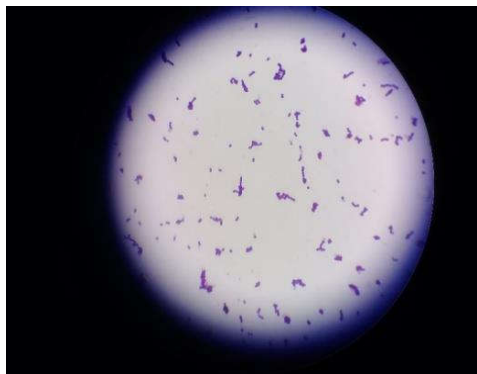
شکل ۱- تصویر جدایه‌های لاکتوباسیل رنگامیزی شده به روش گرم

آزمون همولیز برای کلنی‌های منتخب صورت گرفت. جدایه‌های L۱۵، L۱۶، L۱۹ و L۳۵ بدون همولیز (گاما)، L۱۷، L۱۸، L۲۰ و L۱۴ همولیز کامل (بتا)، L۳۰، L۳۳ و L۸ همولیز ناقص (آلفا) را نشان دادند.