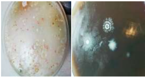
شکل شماره ۱: کشت نمونه‌های خاک بر روی محیط کشت‌های ISP2، Humic acid agar. Gause's No.1

از ۶۰ نمونه خاک مورد بررسی ۲۰۰ اکتینومیست بر اساس روش‌های استفاده شده در این مطالعه بر اساس ویژگی‌های فنتوتیپیک و رنگ‌آمیزی گرم جدا شد.