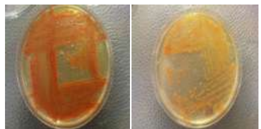
شکل شماره ۳: کلنی‌های میکرومونوسپورا در محیط کشت تریپتیکاز سوی آگار