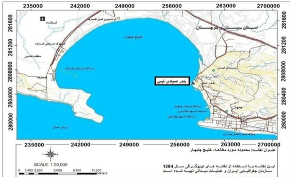
شکل ۱: محل نمونه‌برداری. خلیج چابهار - دریای عمان