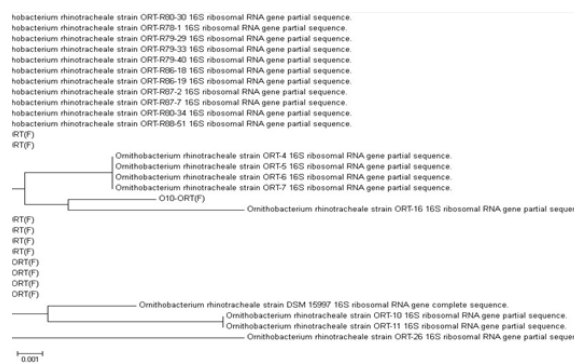
تصویر ۳- درخت فیلوژنی سویه های ORT

نتایج PCR تعیین توالی شده و نتایج تعیین توالی همه سویه ها توسط نرم افزار BioEdit مقایسه شد. نتایج مقایسه توالی در هر ۱۵ نمونه مشابه گزارش شد.