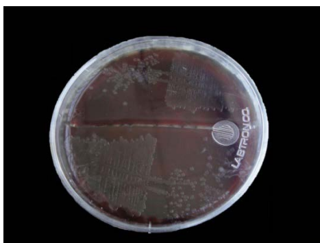
تصویر ۱ - کشت ORT روی بلاد آگار

کشت تمام نمونه های مشکوک به ORT که آزمایش های بیوشیمیایی آنها در موسسه تحقیقات واکسن و سرم سازی رازی انجام شده بود مثبت بود و پس از ۴۸ ساعت کلنی های ریز خاکستری تا خاکستری مایل به سفید، مدور و محدب روی محیط ایجاد کرد(تصویر ۱).